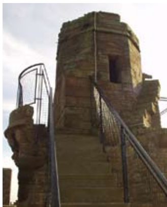
Sgàil-ionad na Banrigh Mairead

Bu toil leis an luchd-rìoghail Stiùbhartach gach seòrsa spòrs mar bobhladh, boghadaireachd, trèanadh sheabhagan agus seòladh air an loch. Bha eadhon seòrsa sònraichte teanas aca ris an canadh iad 'catchpule'.