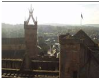
Sealladh on tùr a' coimhead mu dheas