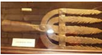
Sleagh easgann, a chaidh lorg ann an Loch Ghleann Iucha