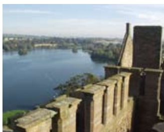
Sealladh thar an loch gu tuath