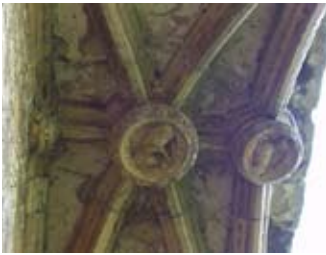
Maise air mullach a' chaibeil

Rugadh Màiri Banrìgh nan Albannach san lùchairt-sa. Chan eil seòmar a breith ann tuilleadh. Bha i na Banrìgh 's gun i ach sia latha dh'aois 's dh'fhan i ann fad seachd mìos mun tug a màthair a Chaisteal Shruighlea i airson a sàbhailteachd.