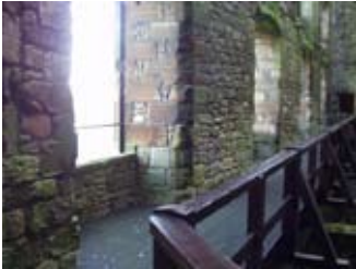
Slighe-coiseachd san raon a tuath

Cha ghabhadh an t-uisge òl 's mar sin dh'òl daoine - pàistean nam measg - beòir, seòrsa de lionn! Tha a taigh-grùdaidh fhèin aig an lùchairt, fo sgiath an ear. Nam b' e tusa duine rìoghail no uasal, dh'òladh tu fion.