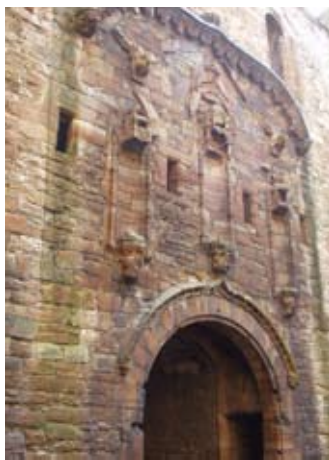
Seann slighe-steach on lios

Aon dleastanas a bha aig na geàrdan 's e clag na lùchairt a bhualadh a dh'innse na h-uarach... ach ciamar a bha fios aca?