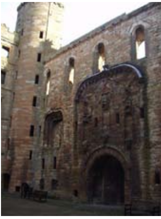
Raon an ear on lios

Bha Rìgh Seumas ag iarraidh an lùchairt a bhith na 'lùchairt spòrsail' iongantach. Chosg e an deicheamh cuid den airgead aige air an lùchairt a thogail!