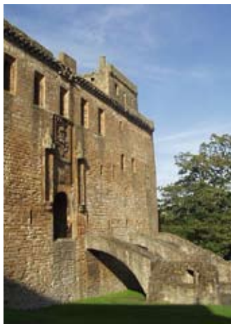
An raon an ear on taobh a-muigh