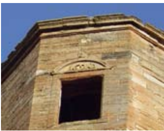
Ceann-latha air raon a tuath