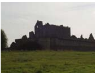
Lùchairt Ghleann Iucha

Gidheadh, mu dheireadh an 16mh linn, bha coltas na h-aoise a' laighe air an lùchairt 's chaidh i na tobht beag air bheag. Mu dheireadh, ann an 1746 an dèidh do dh'fheachdan an riaghaltais a bhith air a gabhail thairis 's iad an tòir air na Seumasaich, chuir teine uabhasach às don lùchairt. On uairsin tha i gun mhullach is gun daoine innte.