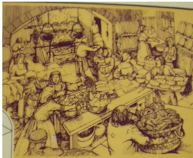
Dealbh tarraingte de chidsin na cùirte fo làn uidheim

Gabh a-steach don talla mhòr is seas ann, ri taobh na saidsean-frithealaidh.