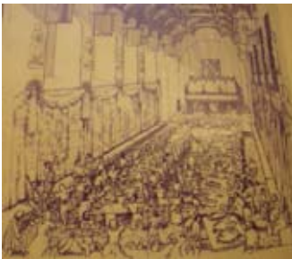
Dealbh tarraingte den Talla Mhòr