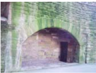
Teallach ann an cidsin na cùirte