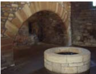
An Cidsin Shìos

Dèan do shlighe sìos an staidhre a-rithist, tro sheòmar-leapa an rìgh 's air a' chiad làr gabh sear air an t-slighe-coiseachd ùr nuadh air a bheil an 'New Wark'.