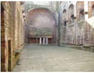
An Talla Mòr

Uaireannan nuair a bhiodh aoighean ro làn ri linn fèiste, rachadh iad gus dìobhairt mun tilleadh iad gus tuilleadh ithe! Theirear gun toireadh iad orra fhèin cur a-mach le bhith a' suathadh an sgòrnan le iteagan.