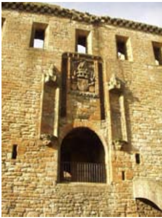
Slighe-steach an ear on taobh a-muigh

O thùs bhiodh ballachan na lùchairt còmhdaichte le rud ris an canar an sgreabhag aoil - coltach ri plàstair?? Chan fhaiceadh tu a' chlach..