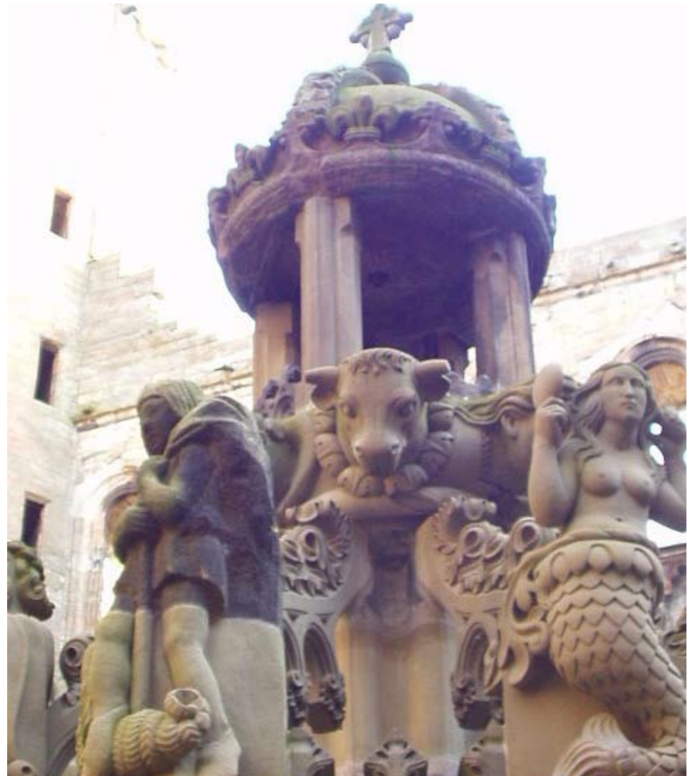
Mion-dealbh den tobar

Uisge ùr airson òl is còcaireachd is mar sin..