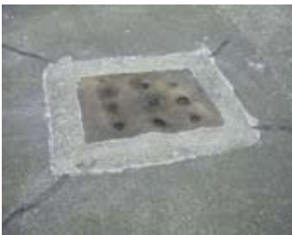
Geama ann an Talla an Rìgh

Thog uaislean agus tosgairean o thall thairis taighean sa bhaile chor 's gum biodh iad faisg air an rìgh is a' bhanrigh.