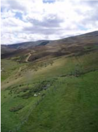
Sealladh den t-seann rathad on tùr-curraig

Cha robhar airson 's gun toireadh saighdearan an teaghlaichean leotha. Nan tigeadh iad bhiodh aca ri cadal san aon leabaidh!