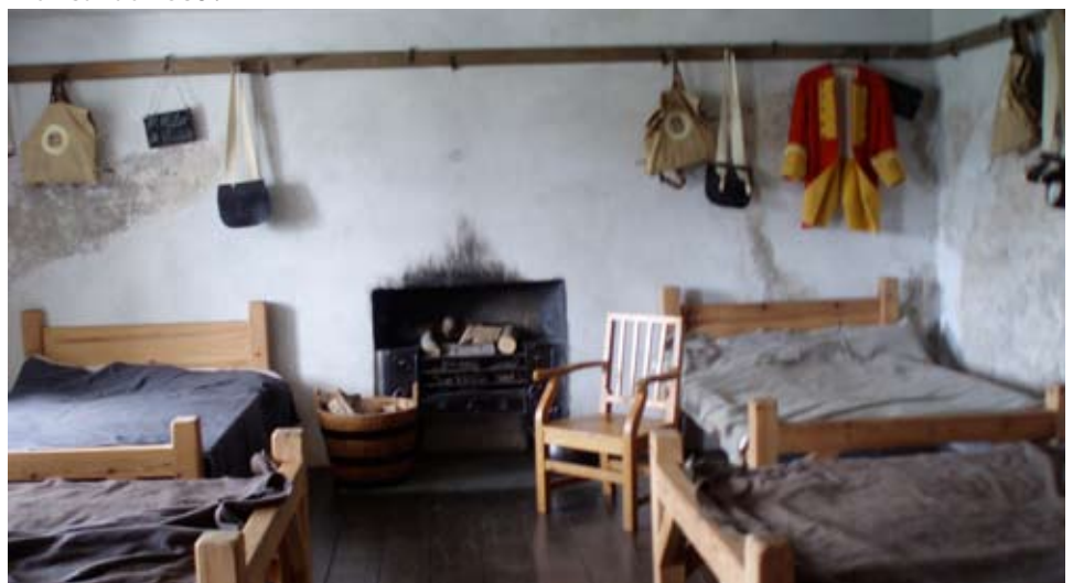
Taigh-feachd ath-chruthaichte aig Corra Garaidh