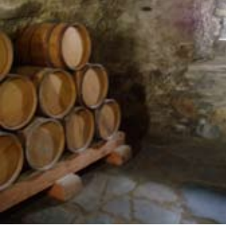
Mac-samhla de bharailllean fùdair san t-seilear

Mun deach iad dh'fhàg na Seumasaich buill-airm air an t-sitig! Ach lorg na saighdearan dearga iad - ubh!