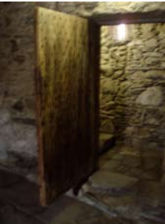
Doras an t-Seileir