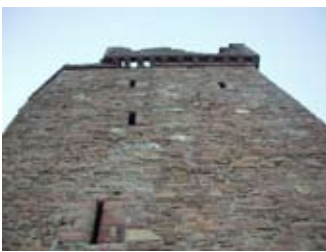
A' coimhead suas an Tùr on Ear