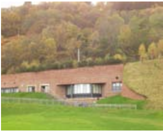
An Ionad Tadhail on chaisteal

Dh'fhosgladh an Ionad Tadhail an 2001 agus bha e air a dhealbh chor is gum biodh e iomchaidh a thaobh dreach na tìre 's nach milleadh e an t-sealladh. An dùil an do dh'obraich seo?