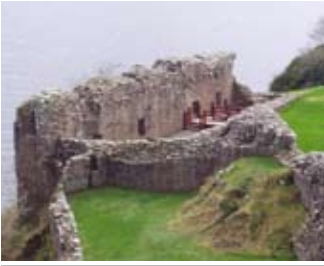
An Talla Mòr