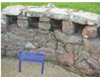
Tuill chalman san taigh-chalman