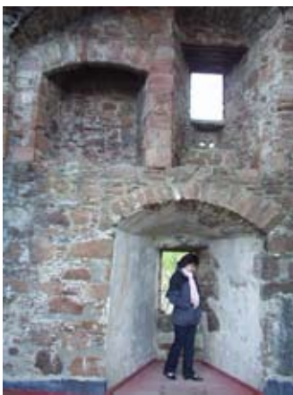
An t-Seòmar a-Muigh