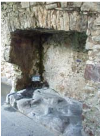
Cùlaist-leapa ann an loidseadh an neach-glèidhidh