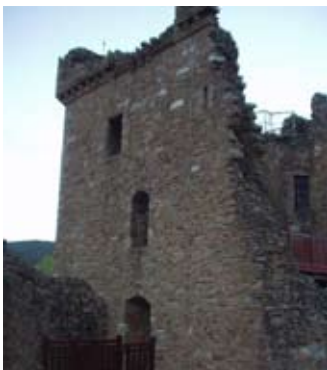
Slighe-steach Tùr nan Granndach