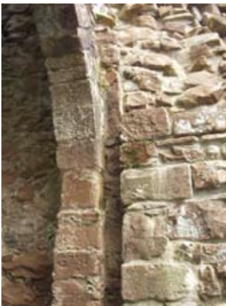
Claisean eirc-chòmhlha aig an taigh-geata