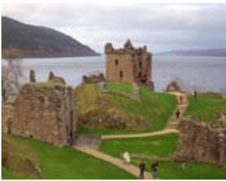
Sealladh on mhullach a' coimhead mu thuath