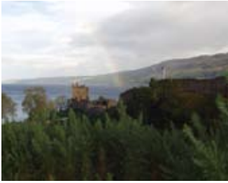
Caisteal a' sealltainn cnoc agus balla-cùrteir