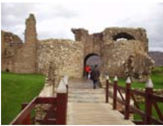
Drochaid-thogalach is taigh-geata

Bhiodh an taigh-geata fada na b' àirde. Cha robh luchd-dìon mu dheireadh a' chaisteil airson 's gun rachadh e a chleachdadh gu bràth tuilleadh. Nuair a dh'fhàg iad, spreadh iad pìosan dheth. Chì thu pìosan den taigh-geata nan laighe mun drochaid. Shoirbhich leotha - cha do ghlac duine sam bith an caisteal a-rithist!