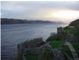
Sealladh gu deas on Tùr

Bheir liosta de na chaidh a ghoid on chaisteal an 1545 deagh shealladh dhuinn air na bha ann: 12 leapanan-clòimh le bobhstairean, plaidean is cuibhrigean; dabhaich-grùdaidh, bioran-ròstaidh, poitean is sgeileidean; ciste le £300 innte; 20 gunna, fùdair, deiseachan-airm; geataichean iarainn; bùird is pìosan eile d' àirneis, agus, gus a h-uile bad dheth a thoirt air falbh, trì bàtaichean mòra.