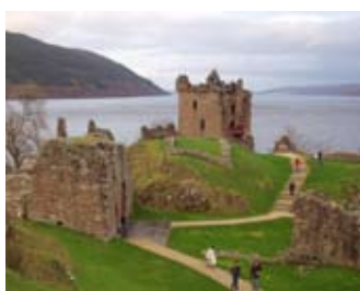
Sealladh mu thuath on mhullach