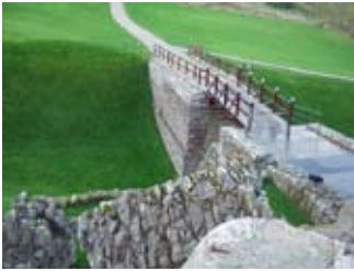
Sealladh thar na drochaid-thogalaich

Mar bu bheartiche thu 's ann na b' fheàrr a bhiodh do phrìosan! Bu tric na h-eucoirich shaidhbeir gan cumail gu cofhurtail.