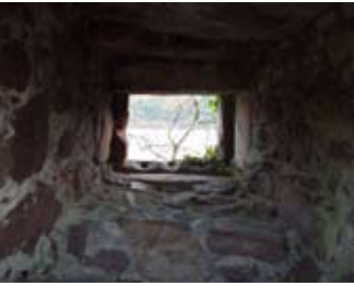
Uinneag san t-seòmar-stòrais