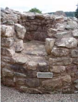
àmhainn san tùr eadarra

Tha an togalach seo na thaigh-grùdaidh cuideachd, far an dèanadh iad lionn air a bheil 'beòir'. Dh'òl daoine cumanta e fad na h-ùine - pàistean fù! Dh'òladh na tighearnan 's na mnàthan uaisle fion. Rachadh an lionn a bhrachadh ann am pòit mhòir chopair am meadhan an t-seòmair-sa.