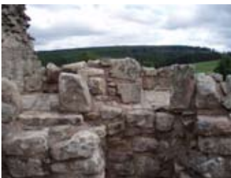
àmhainnean san taigh-fuine