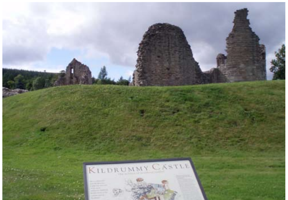
Taobh a-muigh a' chaisteil le pannal-fiosrachaidh