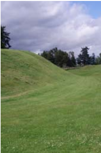
An dìg dhìon leathan