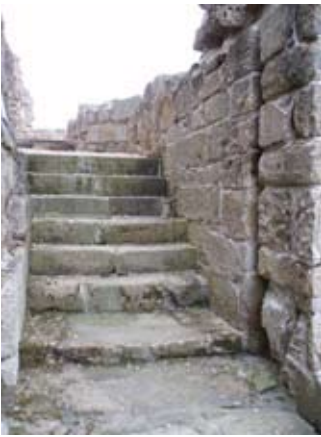
Geata-cùil a' chaisteil (postern gate) le eagan an eirc-chòmhlha

Sna seann làithean cha robh uisge na h-aibhne sàbhailte ri òl mura goileadh e. Mar sin dh'òl a h-uile duine lionn - fiù na pàistean!!