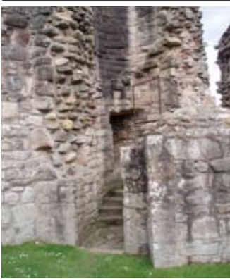
Staidhre san tùr eadarra