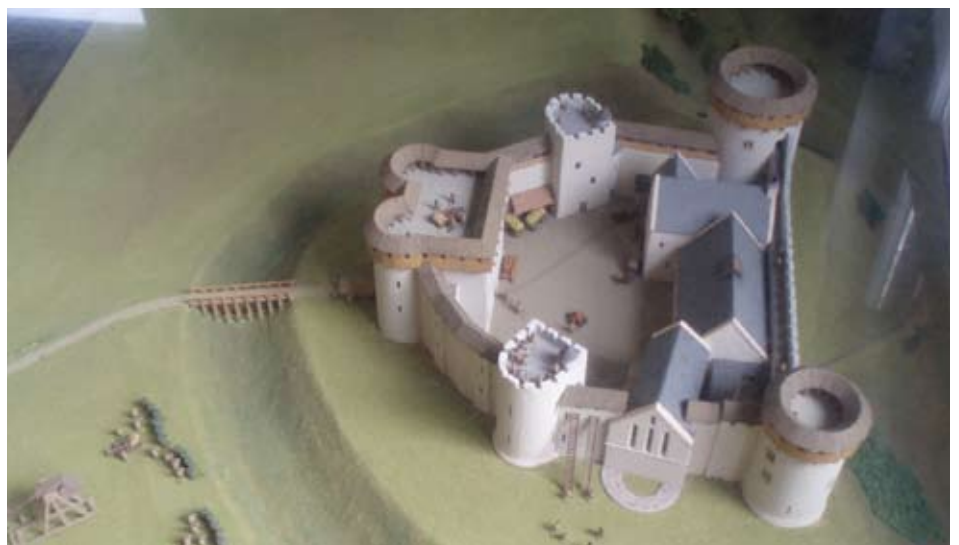
Modail den chaisteal

Fàg am bùth is an ionad-parcaidh is coisich suas an cadha a dh'ionnsaigh a' chaisteil, tro gheata fiodha. Stad ri taobh pannal an fhiosrachaidh.