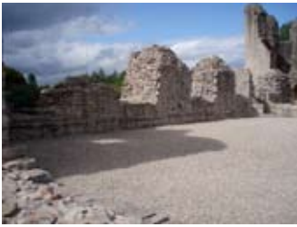
An talla mòr

Thàinig crìoch iomchaidh air a' ghobha chealgaireach. Fhuair e duais an òir o na Sasannaich airson teine a chur ris a' chaisteal - ach b' e òr leaghte e, a chaidh a dhòirteadh sìos a shlugan is a mharbh e.