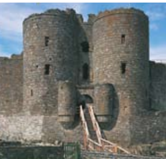
Taigh-geata Caisteal Hàrleach, glè choltach ri mar a bhiodh slighe-steach Caisteal Cinn Droma