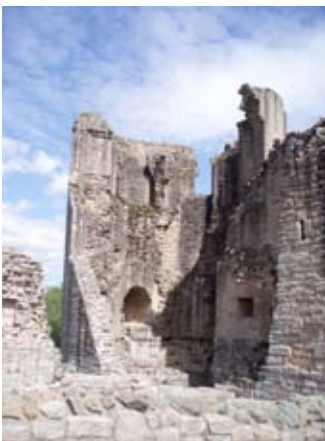
Tùr an Neach-Glèidhidh