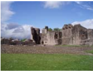
Taobh a-staigh na liosa - a' coimhead a dh'ionnsaigh a' chaibeil

Thuit a' chuid bu mhotha den tùr seo le ràc 200 bliadhna air ais an 1805. Chleachd muinntir an àite na clachan gus an taighean fhèin a thogail.