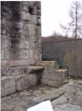
Uinneag le suidheachan