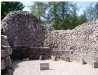
Taobh a-staigh Tùr an t-Sneachda