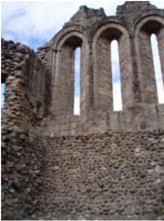
Uinneagan a' chaibeil

Ri linn Raibeart Bhrus bha cha mhòr a h-uile duine an Alba a' dol don eaglais. 'S e Caitligich a bh' annta uile agus 's ann san Laideann a bha na seirbheisean eaglais!