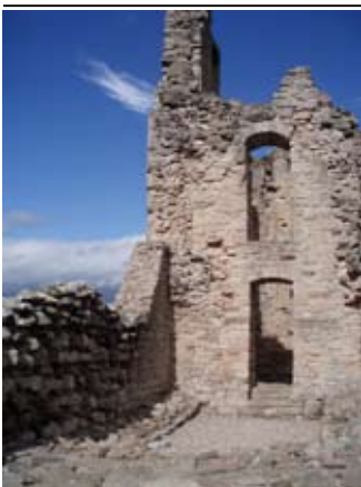
Tùr Elphinstone às Tùr an t-Sneachda