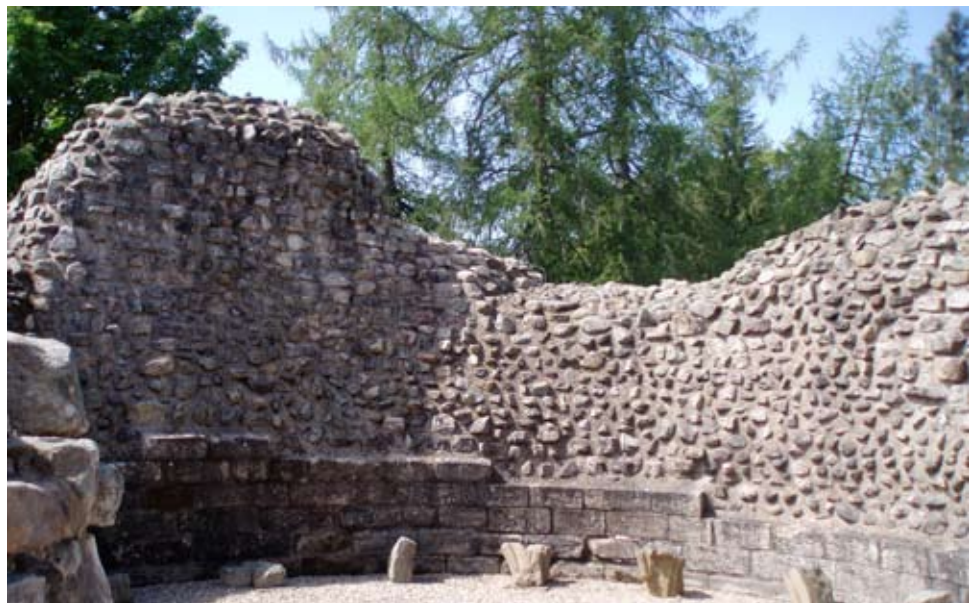
Tùr an t-Sneachda