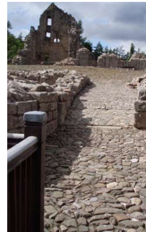
A' dol a-steach do Chinn Droma