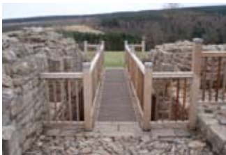
Drochaid an latha an-diugh aig slighe-steach a' chaisteil