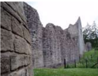
Balla a-muigh a' chaisteil