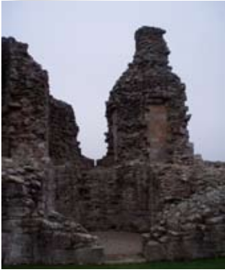
An tùr eadarra

Ri linn Raibeart Bhrus cha robh gunnaichean ann. Shabaid daoine le claidheamh, tuagh, bogha 's saighead. Thug iad ionnsaigh air caistealan coltach ri seo le clach-bhogha mhòr mhòr air a bheil trebuchet, no le reithe-cogaidh air na ballachan.