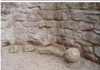
Ball-cloiche san tùr eadarra