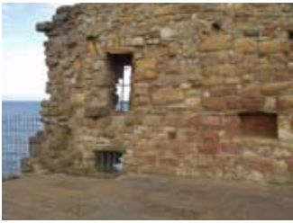
Taigh a' chidsin: fuigheall balla an ear. Tha am fanan sgudail aig bun ìre air chli

Aig cuid de dh'fhèistean rachadh teachd cùrsa na feòla ainmeachadh le buidheann luchd-trombaid. Cuideachd bhiodh ceòl san talla. Cha b' e a chòrd ris a h-uile duine, geta; thuirt aoigh aig fèist eile gun robh nuallan na pìoba coltach ri "bùirich bhèistean".