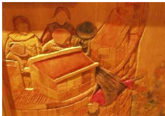
Obair-shnaighte an latha an-diugh san Ionad Tadhail, a' sealltainn murt a' Pheutanaich.

Gabh air ais an t-slighe a thàinig thu 's coisich mun cuairt oir an fheòir, a tha a' sealltainn os cionn na traghad, air dheas.