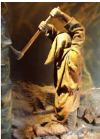
Modail de mhèinnear san Ionad Tadhaill