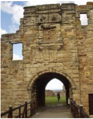
An Geata a deas - slighe-steach Àrd-Easbaig Hamaltan.