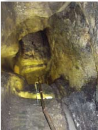
A' coimhead sìos sa mhèinn-bhacaidh

Chaidh a' mhèinn agus a' mhèinn-bhacaidh a lìonadh a-steach an dèidh na sèiste. Chaidh iad air dhìochuimhne 's cha deach an ath-lorg gu 1879 nuair a bhathar a' togail taigh ùir. Tha an t-slighe-steach tùsail don mhèinn a-nis fon taigh ùir air oisean Sràid a' Chaisteil.