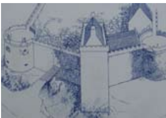
Dealbh tarraingte a' sealltainn nan daingneachan