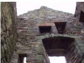
An t-sealladh a' coimhead suas am balla deas den tùr thoiseach. Air chli tha am beàrn as an rachadh stob na drochaid-thogalaich 's e ga h-àrdachadh.