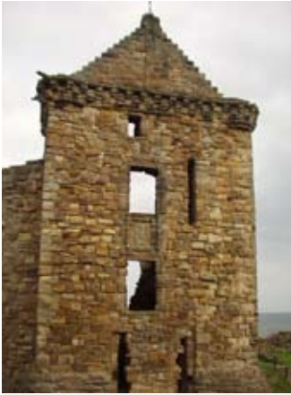
Tùr Toiseach – làrach an t-seann slighe-steach