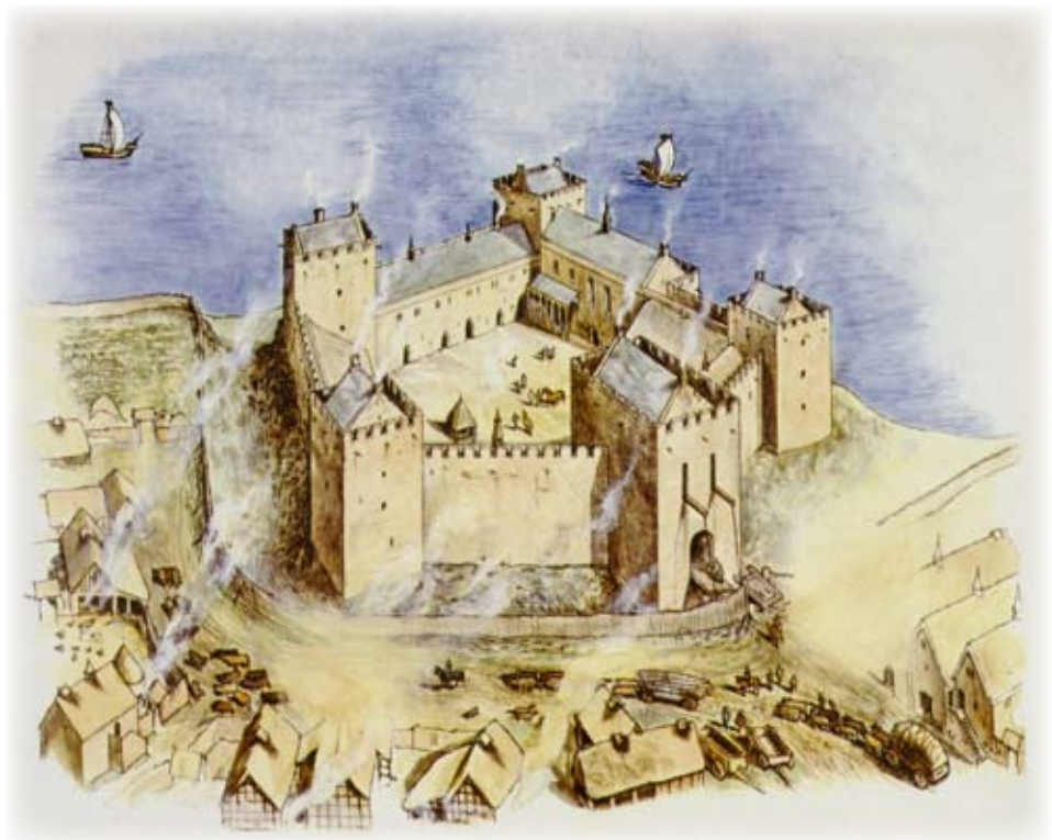
Caisteal Chill Rìmhinn: Dealbh neach-ealain