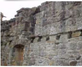
Am balla a deas de sheòmraichean Àrd- Easbaig Hamaltan

Bha luchd-tadhail gun iarraidh aig Càirdineal Peutan. An 1546 fhuair buidheann, aig nach robh taobh ri Peutan a thaobh na h-Eaglais, a-steach don chaisteal fo chulaidh chlachairean. Nuairsin bhris iad a-steach gu seòmraichean a' Chàirdineil is mhurt iad e. Chroch iad a chorp a-mach air an uinneig ann am plaide-leapa.