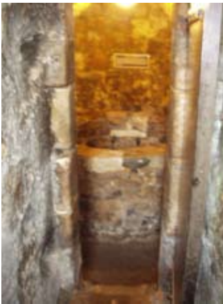
Slighe-steach gu sloc-buideil a' phrìosain

Chaidh an ciad àrd-easbaig riamh a chur fo ghlais ann am prìosan a chaisteil fhèin. Chaidh Àrd-Easbaig Pàdraig Greumach a chur fo ghlais an 1478 o chionn 's gun do shaoil daoine gun robh e cràicte 's gun cuireadh e nàire air an Eaglais.