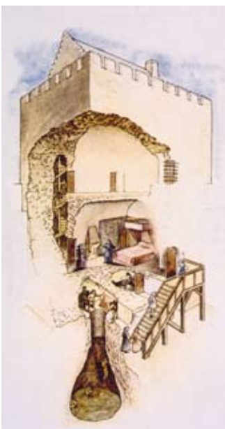
Dealbh tarraingte de thar-roinn a' phrìosain