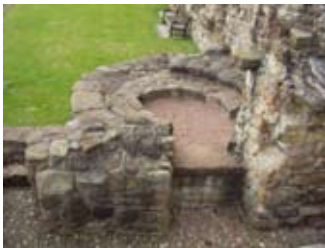
Àmhainn an t-arain