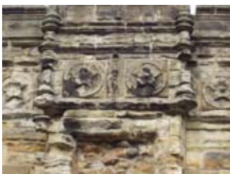
Samhla dìthean còig-bhileach Àrd-Easbaig Hamaltan