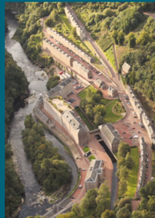
New Lanark