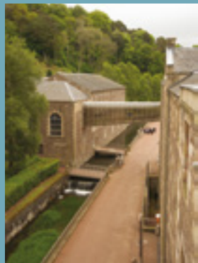
Corriente del caz del molino