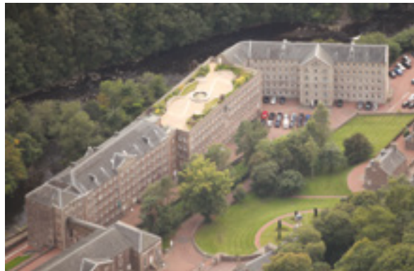
Fábrica algodonera con jardín en la azotea estilo moderno

Si desea obtener más información sobre la zona y la historia natural del valle Clyde, consulte la última página de este folleto donde figuran los enlaces a Scottish Wildlife Trust y Avon Valley Landscape Partnership.