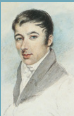
Robert Owen