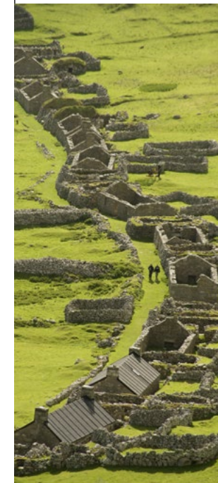
An t-Sràid, Hirta