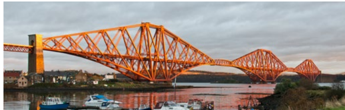
Drochaid Foirthe bho North Queensferry a Tuath

Tha gach làrach an seo nan sàr annas-làimhe a thaobh an togail agus an dealbhadh cloiche. Còmhla, tha iad a' riochdachadh aon de na deilbh-tìre as beartaiche a tha buan o Linn Ùr na Cloiche air taobh an iar na Roinn Eòrpa.