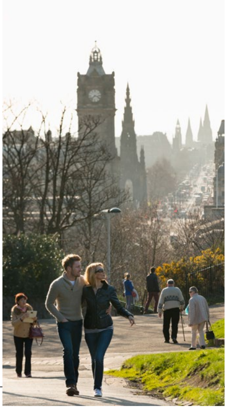
Sràid a 'Phrionnsa bho Calton Hill