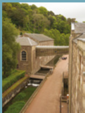
La gora, il canale che porta l'acqua al mulino