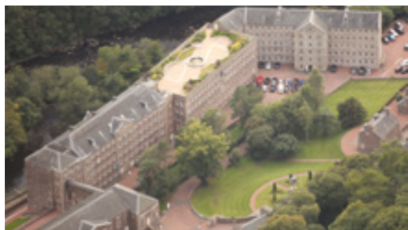
Stabilimento del cotonificio con un moderno giardino sul tetto

Per approfondimenti sull'intera regione e sulla storia naturale della valle del Clyde, consultate il retro del presente opuscolo dove troverete i dati di contatto dello Scottish Wildlife Trust (Fondo per la conservazione della flora e della fauna in Scozia) e della Clyde e Avon Valley Landscape Partnership.