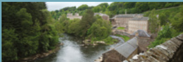
Panorama dalle cascate