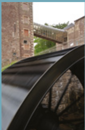
La ruota idraulica

La diga, la gora e i corsi d'acqua che dalla metà del 1780 hanno portato energia idrica alla fabbrica sono tuttora in uso. Sentieri tra gli alberi conducono dal villaggio a punti panoramici dai quali si possono ammirare le Cascate del Clyde e la gola.