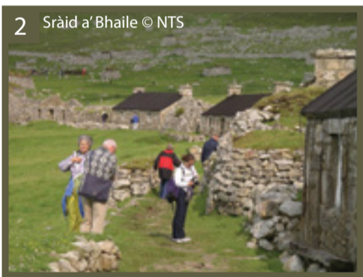
2 Sràid a' Bhaile

Tha Drochaid Foirthe na samhla air an ìre as àirde a ràinig luchd-togail dhrochaidean san naoidheamh linn deug. 'S i an drochaid "cantilever trussed" as motha san t-saoghal. Nuair a chaidh a fosgladh ann an 1890 bha an sìneadh drochaide a b' fhaide san t-saoghal innte. B' i cuideachd a' chiad structar cudromach a thogadh le stàilinn màlda. An-diugh tha i na samhla cumhachdach de dhualchas