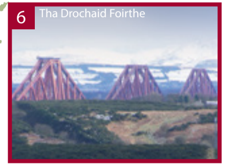
6 Tha Drochaid Foirthe

Tha Cridhe Linn Ùr na Cloiche ann an Arcaibh air cruth-tìre bho Linn Ùr na Cloiche cho beartach 's a tha ri fhaighinn air taobh a deas na Roinn Eòrpa. Tha a charraighean dachaigheil agus deas-ghnàthach a' foillseachadh sàr obair dealbhachaidh agus togail, a' toirt dhuinn seallaidhean air leth air comann-sòisealta, sgìlean agus creideamhan spioradail nan daoine a thog iad.