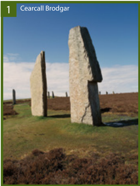
1 Cearcall Brodgar

Tha Cridhe Linn Ùr na Cloiche ann an Arcaibh air cruth-tìre bho Linn Ùr na Cloiche cho beartach 's a tha ri fhaighinn air taobh a deas na Roinn Eòrpa. Tha a charraighean dachaigheil agus deas-ghnàthach a' foillseachadh sàr obair dealbhachaidh agus togail, a' toirt dhuinn seallaidhean air leth air comann-sòisealta, sgìlean agus creideamhan spioradail nan daoine a thog iad.