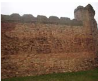
Balla 's na th' air fhàgail den tùr an ear