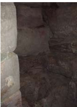
Taigh beag sloc a' phrìosain