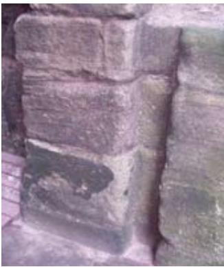
Claisean an eirc-chòmhlha

B' e obair an neach-glèidhidh, no maor-sithe, tè de na h-obraichean cudromach sa chaisteal. Feadhainn eile 's e an stiùbhard, a bha os cionn nan sgalagan uile; am marasgal, os cionn còmhdhail is conaltraidh; agus sagart/ministear, a bhiodh ri litrichean, seirbheisean- eaglais is cùisean spioradail. Is dòcha gum biodh uiread is 150 sgalag ag obair aig Tantallon nuair a bhiodh iarlaichean Aonghais aig an taigh.