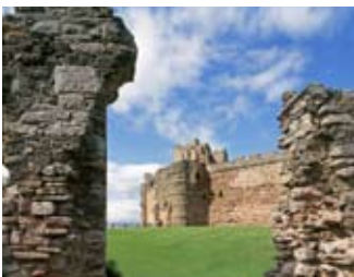
Na th' air fhàgail den tùr-ghunna