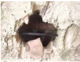
An talla a' sealltainn suidheachadh a' mhullaich.