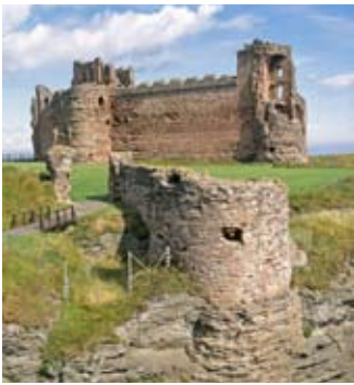
An Geata a-Muigh

Air suaicheantas an teaghlach Dhubhghlais tha cridhe dearg. Tha seo ann o chionn 's gur e Sir Seumas Dubhghlas, fear de dh'fhìor-dhìlsean Raibeart Bhrus, a thug cridhe Bhrus don Talamh Naoimh an dèidh a bhàis an 1329.