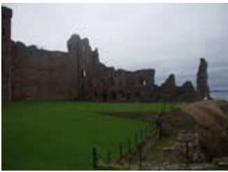
Balla a' chaisteil on taobh a-staigh den chlobhsa

O thùs bhiodh mullach fiodh air an tobar chor 's nach sèideadh sgudal ann. Bhiodh siostam ulag ann airson nam bucaidean a tharraing suas 32 meatair. An dèidh an caisteal a bhith air a thrèigsinn an 1651 lìon an tobar suas mean air mhean is chaidh e à feum. Chaidh ath-lorg 's a chladhach aig deireadh nan 1800an. Am bu toil leat deoch às a-nist?