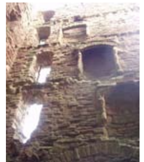
A' coimhead suas san tùr mheadhanach

Gabh tron doras is seas ris an tobar sa chlobhsa.