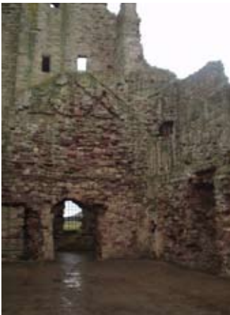
Staidhre a' dol gu galaraidh an luchd-ciùil.

Aig cuid de dh'fhèistean dh'ainmicheadh cùrsa na feòla le buidheann luchd-trompaid. Bhiodh ceòl san talla cuideachd. Cha b' ann ris a h-uile aoigh a chòrdadh seo geta; thuirte aoigh aig fèist eile gun robh nuallan na pìoba coltach ri "bùirich bhèistean"!