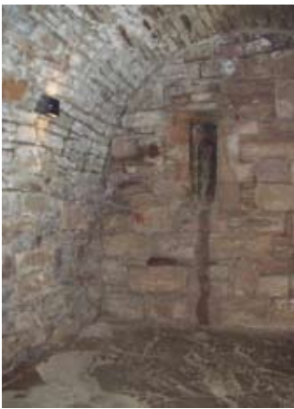
Taobh a-staigh sloc a' phrìosain