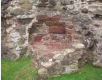
Na th' air fhàgail de dh'àmhainn sa chidsin

Mu dheas air an tùr mheadhanach chì thu doras beag aig bàrr staidhre. Gabh suas an staidhre chumhaing 's aig a' bhàrr gabh air chli. Gabh air na caisealachdan gus an seas thu aig mullach an tùir mheadhanaich, a' coimhead ri tìr.