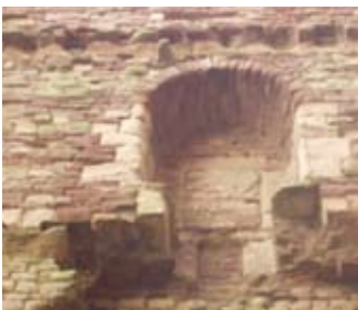
Uinneag a chaidh a dhùnadh a-steach san tùr mheadhanach