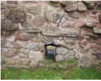
Fanan sgudail sa chidsin

Bha na teallaichean cho mòr 's gun robh rùm annta do ghille a bhith na sheasamh ri taobh an teine a' tionndadh bior-ròstaidh. 'S e an turnbrochie a bh' air.