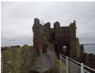
Sealladh de na caisealachdan

Aig bonn na staidhre thig a-mach don chlobhsa. Gabh air dheas. Gabh tron doras mu dheireadh air do làimh dheis 's bidh tu ann an seòmar aig bonn an tùir an ear.