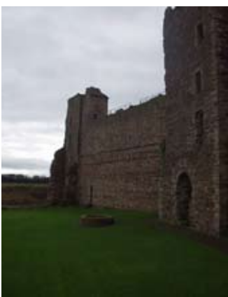
An tùr meadhanach is an tobar on chlobhsa