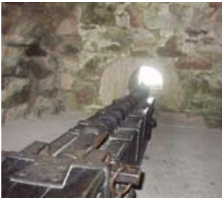
Mac-samhla gunna san tùr an ear

Bha tòrr mòr uidheamachd cogaidh aig Tantallon. Bha canain mhòra air bàrr nan caisealachdan agus a-staigh sa chaisteal bha gunnaichean na bu lugha. Bha buill-airm eile, spìcean mòra air an robh 'pìcean' is 'pìcean-catha', nan tòrr ri taobh nan geataichean.