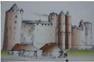
Dealbh neach-ealain de Chaisteal Tantallon- 1360

Thogadh na pìosan is aosta den chaisteal le clach-ghainmhich dhearg. Ma sheallas tu air na h-àillean faisg air làimh chì thu gur ann às a seo a thàinig a' chlach. Bha na pìosan a chuireadh ris a' chaisteal an dèidh seo togte le diofar seòrsa cloiche - clach-ùrach car uaine. Coimhead a-mach airson nam pìosan uaine 's tu a' dol mun cuairt - còd-datha feumail!