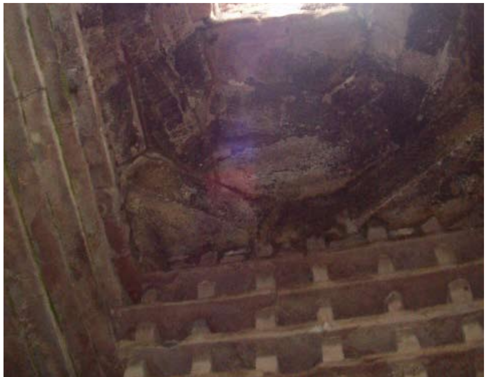
Tuill taobh a-staigh an Taigh-Chalman.