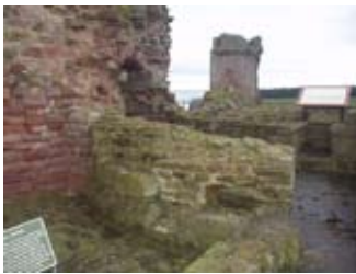
Tobhta an tùir chruinn

An 1568 mhàrsail Seumas V le arm air Caisteal Tantallon. Agus iad a' caismeachd bha Ding doon Tantalloun! Ding doon Tantalloun! aca, a' ciallachadh gun robh iad airson na ballachan a leagail. An dèidh ionnsaigh fichead latha ruith Seumas a-mach à fùdair 's tharraing e a-mach le fheachdan, ach fhuair na ballachan bualadh trom.