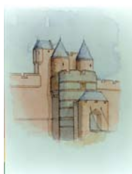
Iomhaighean den taigh-ghèata atharraichte